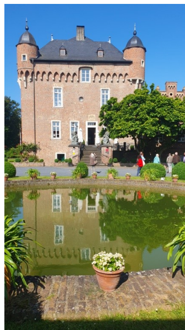
Schloss Loersfeld mit schönem Detail

Traditionell ist der zweite Tag kulturellen Themen vorbehalten. Geführt von „Zofe Brunhilde“ besichtigten wir die beiden Wasserschlösser, Schloss Loersfeld und Schloss Paffendorf, nahe Bergheim.