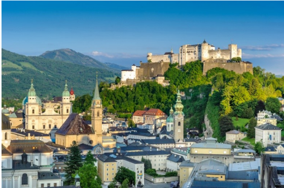
Bildunterschrift