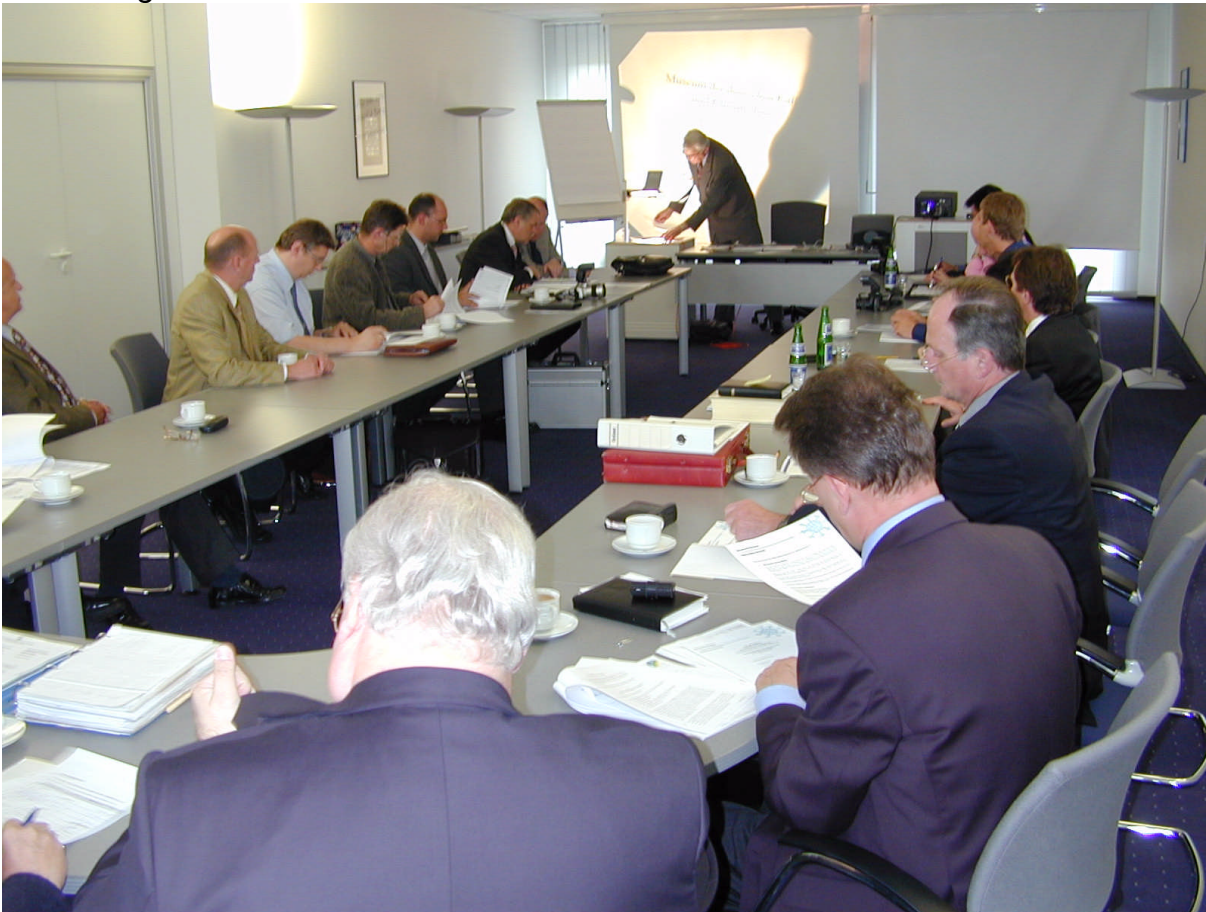
Bild: Gründungsversammlung am 25.5.2000

Der Historische Kälte- und Klimatechnik e. V. (HKK) wurde am 25. Mai 2000 durch Initiative der Organisationen* der Deutschen Kälte- und Klimatechnik gegründet und dessen Ziele wie folgt formuliert: Die Initiative "Historische Kälte- und Klimatechnik e.V." der Organisationen der deutschen Kälte- und Klimabranche betrachtet es als ihre Aufgabe, den Entwicklungsstand von den Anfängen bis heute zu bewahren und der Öffentlichkeit zugänglich zu machen. In diesem Zusammenhang betreibt der Verein den Aufbau einer kälte- und klimatechnischen Sammlung in Maintal mit der "Historischen Sammlung Heinz Bacher" als Basis.