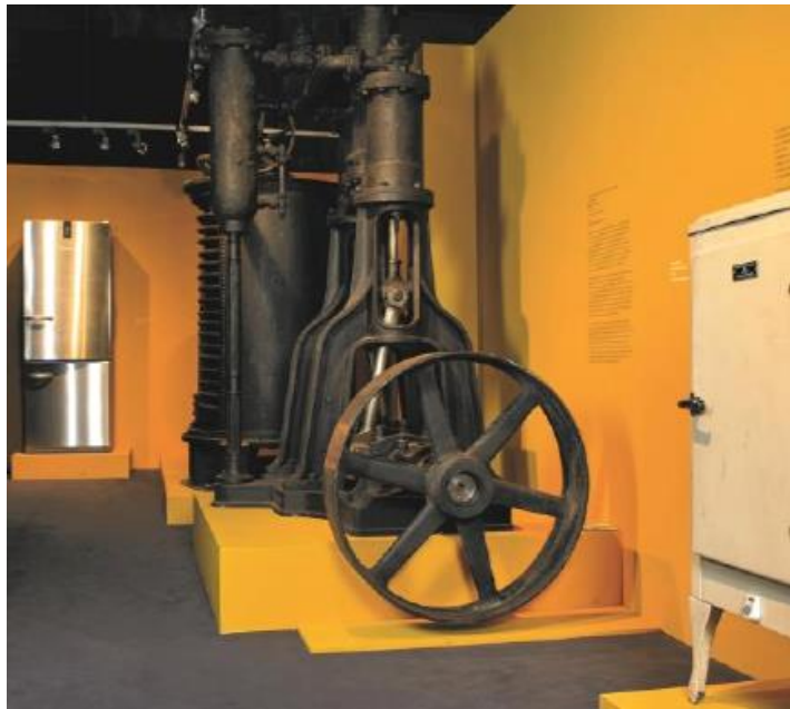
Ausstellungsbild aus Genius I

Vor ca. 80 Jahren hat man die Ur-Lindemaschine offensichtlich noch ganz anders geschätzt – es wurden mindestens 2 Kopien der Maschine angefertigt - das eine Modell befindet sich heute im Depot des Deutschen Museums München, das andere ist noch im Besitz der Firma Linde.