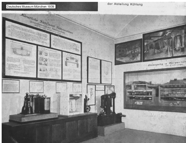
Bild von der Ausstellung im Deutschen Museum 1939

Vermutlich am gleichen Ort haben wir 2006 die Lindeausstellung im Museum besucht - von den früheren Ausstellungsstücken ist nur noch der „kleine“ stehende Kreuzkopfverdichter geblieben, den man schon in der Mitte des Bildes von 1939 sieht!