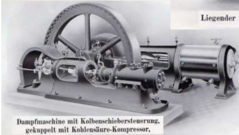
Dampfmaschine mit Kolbenschiebersteuerung, gekuppelt mit Kohlensäure-Kompressor,

Mit diesem umfangreichen Programm konnten dann auch Großprojekte wie die Eisfabrik der Norddeutschen Eiswerke in Berlin Köpenicker Straße 40/41, verwirklicht werden.