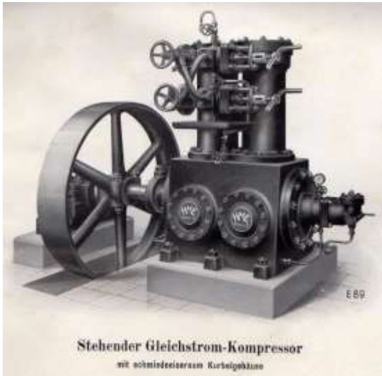
Stehender Gleichstrom-Kompressor mit schmelzeisernen Kurbelgehäuse